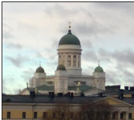
Dom zu Helsinki