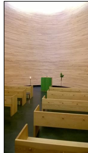
Kirche der Stille